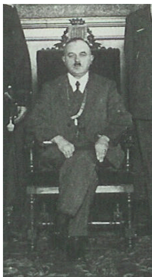
Burgemeester Doorn op 'zijn' zetel

Bijzondere aanwinsten in de afgelopen drie maanden zijn onder meer de burgemeestersstoel uit de raadszaal van het