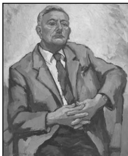
Twee topstukken uit de collectie.