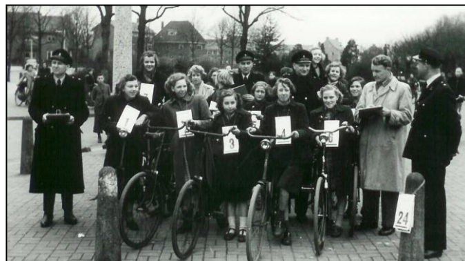
Een bekend beeld (1952) uit onze herinnering: het Verkeersexamen, georganiseerd vanuit de scholen.