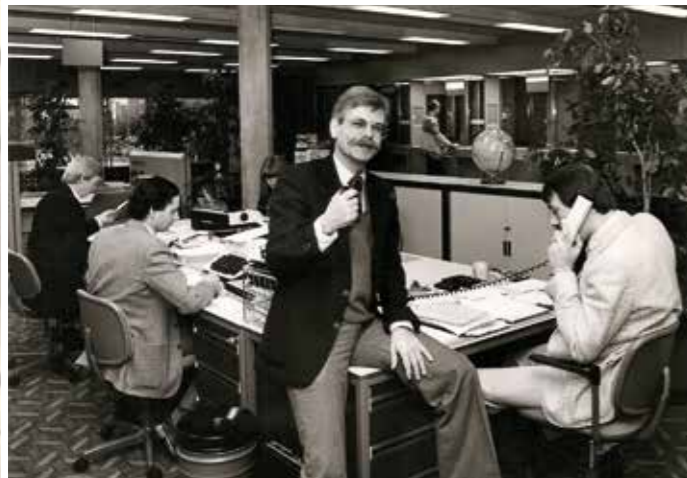
DeAMRO bank winkelcentrum Walburg 1980.

In 2003 ging ik met pensioen bij de bank en daarom had ik meer tijd voor mijn vrijwilligerwerk bij ATOS (bij de regionale omroep is het wél betaald werk maar niet bij de lokale omroep). Aangezien politiek mij erg interesseerde, ging ik vanaf 2003 ook politieke debatten leiden. Verder deed ik algemene verslaggeving, zoals bijvoorbeeld de brand in de Kijfhoek in 2011 en interviewde ik ook mensen zoals bijvoorbeeld de ondernemer van het jaar.