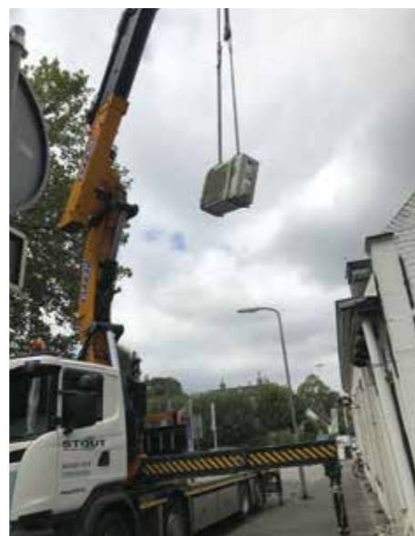
Er moest zelfs een hijskraan aan te pas komen om de buitenunit over het dak heen te tillen.

En dat was nog niet alles... Vooral bij de hoge temperaturen van afgelopen zomer bleek nog maar eens dat de temperatuur in de bovenzaal verre van aangenaam was. De sterk