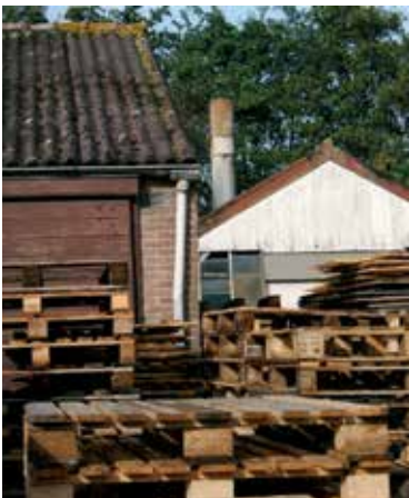
Opslag pallets aan de Krommeweg.

Ik ben niet alleen voor mijzelf bezig. Ik doe graag dingen voor het dorp en omstreken. Zo ben ik bijvoorbeeld 57 jaar dijkwachter geweest voor het Waterschap. De bedoeling is dan om, wanneer het nodig is, te patrouilleren en te rapporteren. En uiteraard om vergaderingen te bezoeken van het Waterschap. Verder ben ik sinds 10 jaar lid van de Ledenraad van de Rabobank